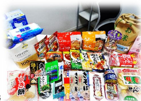
お福分けの基本セット