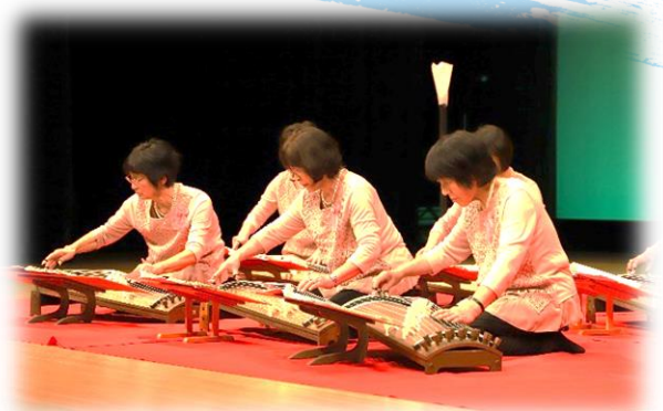
琴音サークルのみなさん